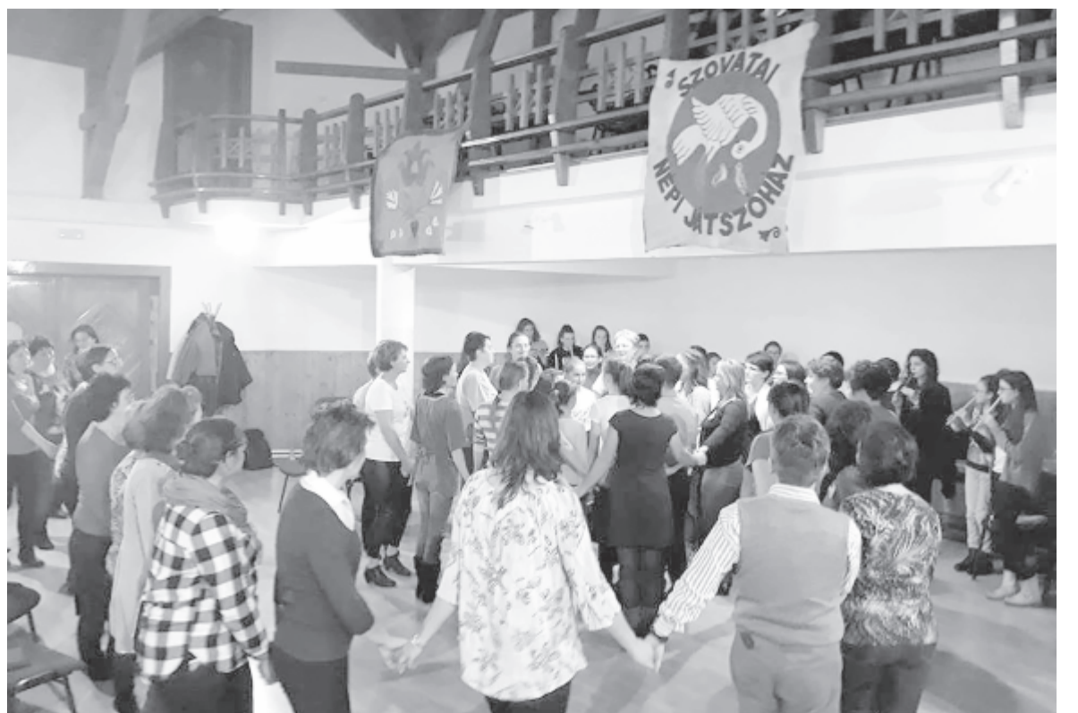
Interaktív program zajlott, mindenkit bevontak, megmozgattak

játsszóházas programokat, decemberben az adventi és karácsonyi ünnepek szokásait – lucázás, betlehemezés, kántálás, aprószenekelés – elevenítik fel és kézműves-foglalkozásokat szerveznek. A farsangi időszakban a fonók hangulatát idézik fel, de nem maradhat el a farsangtemetés sem, hűsvétra hangulódva tojásfestésre, tojásírásra oktatják az apróságokat, akik pünkösdkor a sövidéki hesspávázást ismerhetik meg, míg nyáron kézműves- és néptáncbálokat szerveznek számukra. A pedagógusoknak szakmai továbbképzőket ajánlanak (a hétvégi volt már az ötödik alkalom), a nagyközönség számára pedig néptáncalátkozókat szerveznek. Mindezt pedig teljesen bérmentve, önkéntes munkával.