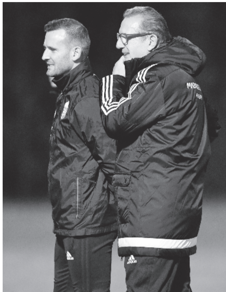
Szélesi Zoltán megbízott szövetségi kapitány (b) és Georges Leekens, a magyar labdarúgó-válogatott új szövetségi kapitánya, a Luxemburg ellen készülő csapat edzésén a telki edzőközpontban 2017. november 6-án.

Szélesi Zoltán kifejtette, hogy a magyar labdarúgó-válogatott leendő szövetségi kapitánya, Georges Leekens a jelenlegi munkában nem vesz részt, azaz ő készíti fel a csapatot a csütörtöki, luxemburgi barátságos mérkőzésre.