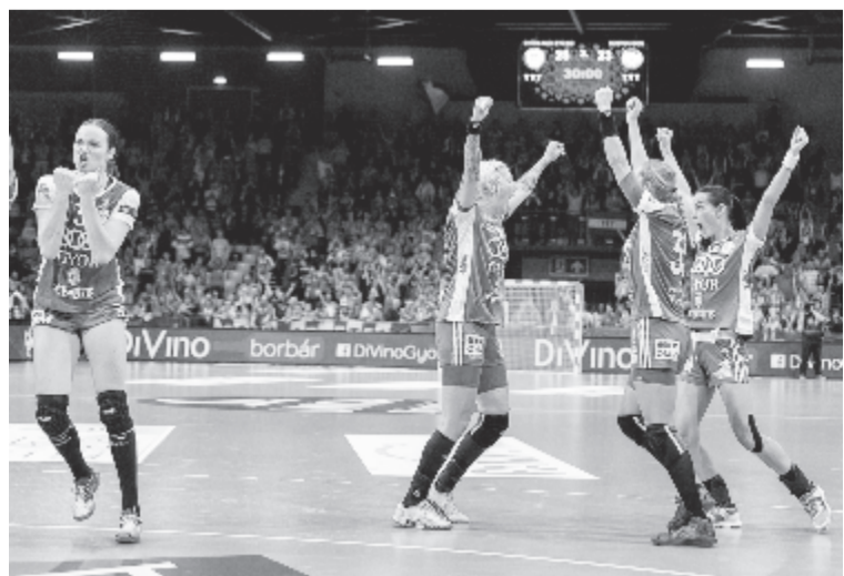
A Győr játékosai örülnek a győzelemnek a női kézilabda Bajnokok Ligája Győri Audi ETO KC – Rosztov-Don (oroszl) mérkőzés végén a győri Audi Arénában 2017. november 6-án.

* A Williams istálló pilótája, Felipe Massa az idény végeztével befejezi pályafutását a Forma-1-ben. A 36 éves brazil versenyző Instagram-oldalán jelentette be döntését, eszerint a hét végi hazai viadalon, a Brazil Nagydíjon, majd a szezonzárón, a november 26-i Abu-dzabi Nagydíjon indul még. Massa 2008-ban aratta legnagyobb sikerét, amikor is második lett a világbajnoki pontversenyben, emellett összesen 11 vb-futamon győzött a Ferrarival.